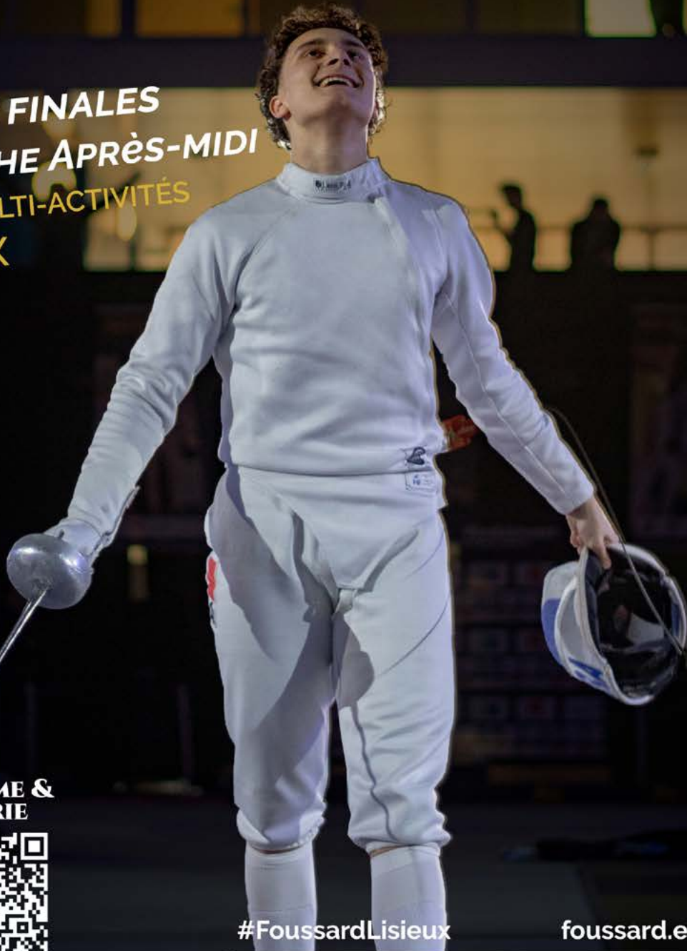
Création de l'affiche : Agence CAMEMBER. Crédit photo : Robin Garcia

PHASES FINALES DIMANCHE APRÈS-MIDI SALLE MULTI-ACTIVITÉS LISIEUX